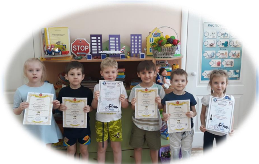
Участие в дистанционных олимпиадах.

Таким образом, в результате реализации проекта «Шахматная игра – эффективная модель развития интеллектуальных способностей детей», вовлеченность родителей в активную деятельность по интеллектуальному развитию детей посредством шахмат составила - 100%