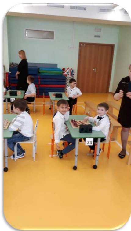
Городской шахматный турнир